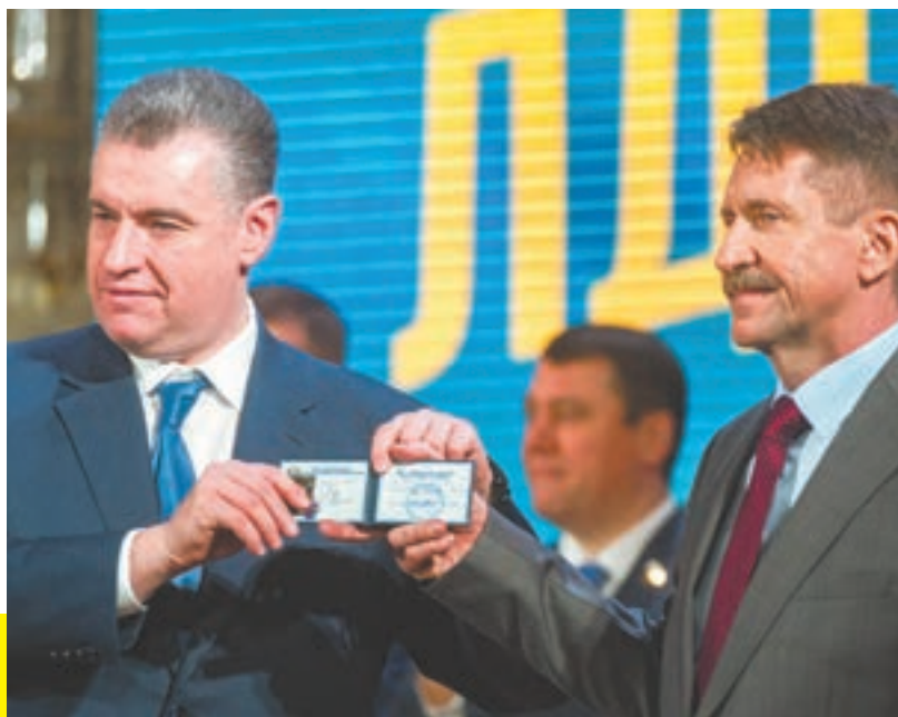
Виктор Бут получает партийный билет. 2022 г.

«Спасибо Вам, Леонид Эдуардович, за все, что вы сделали для меня. Я сидел в тюрьме в США 10 лет. И еще больше бы сидел, если, конечно, моя страна за меня не стала бороться. Наш Президент, моя семья, посольство России и, конечно, ЛДПР — за меня все боролись. Просто хочу сказать, что я очень благодарен всем, кто меня поддерживал все эти годы, и за мое возвращение. ЛДПР добивалась моего возвращения, еще когда Владимир Вольфович Жириновский был жив, я знаю, что он лично работал над моим возвращением. И сейчас под руководством Леонида Эдуардовича Слуцкого ЛДПР