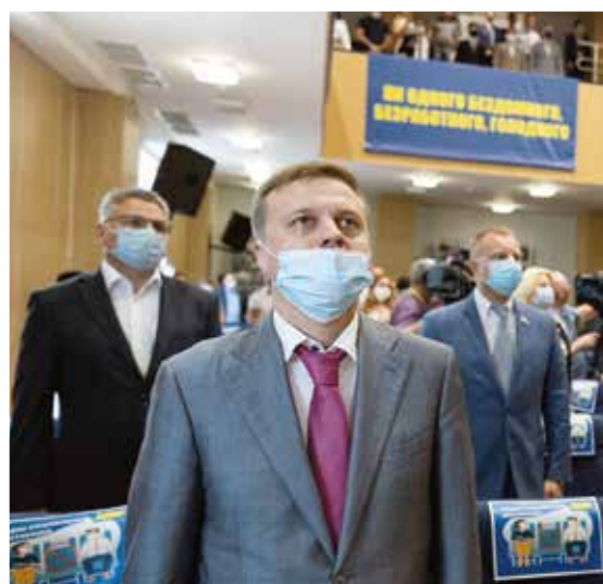
XXXIII СЪЕЗД ЛДПР