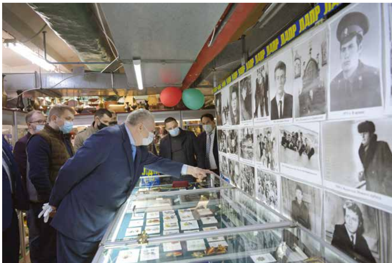
ВЫСТАВКА В ЧЕСТЬ 75-ЛЕТИЯ ЛИДЕРА ЛДПР