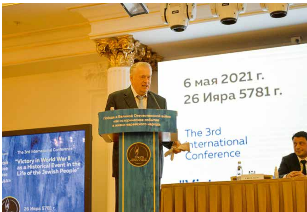
КОНФЕРЕНЦИЯ «ПОБЕДА В ВЕЛИКОЙ ОТЕЧЕСТВЕННОЙ ВОЙНЕ КАК ИСТОРИЧЕСКОЕ СОБЫТИЕ В ЖИЗНИ ЕВРЕЙСКОГО НАРОДА»