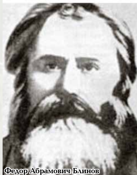
Федор Абрамович Блинов