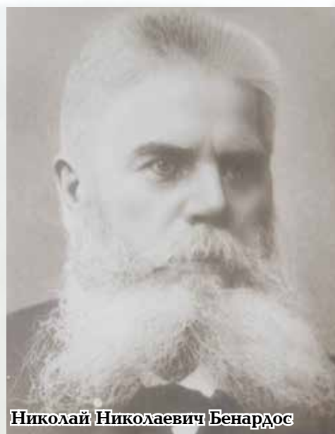
Николай Николаевич Бенардос

Александр Михайлович 14 мая 1885 года, заканчивая свою последнюю лекцию, с гордостью говорил о росте русской химической науки и предсказывал ей блестящее будущее. Созданные при его участии крупнейшие русские химические школы — Казанская, Петербургская, Московская — продолжили развитие органической химии, внося достойный вклад не только в отечественную, но и в мировую науку.