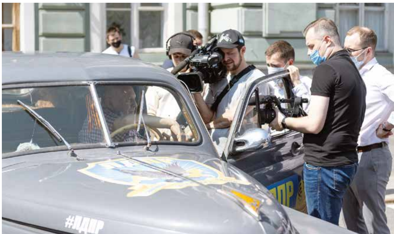
ЛЕГЕНДАРНОЙ ВОЛГЕ — 75!