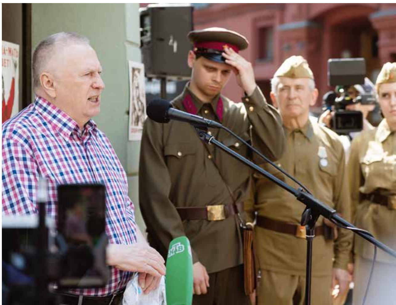
РЕКОНСТРУКЦИЯ 22 ИЮНЯ 1941 ГОДА