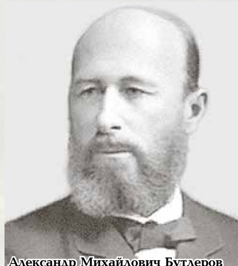
Александр Михайлович Бутлеров

https://vladimir.bezformata.com/listnews/amfibiyu-benardosa-ispitali-naklyazme/19341391/ https://saratovskiy.com/index.php?ukey=AUXPAGE_EMBANKMENT-3&did=283 https://www.pinterest.ru/pin/445363850629492991/ http://db.ranar.spb.ru/file.phtml?path=persons/16918/31090983.jpg